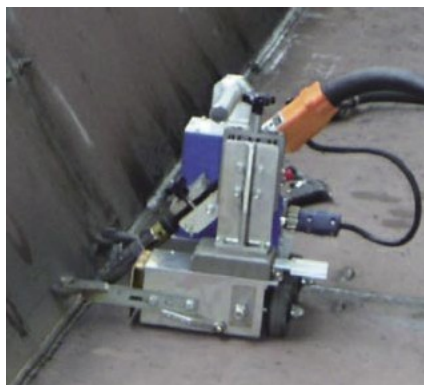
造船ブロックの溶接に使用中